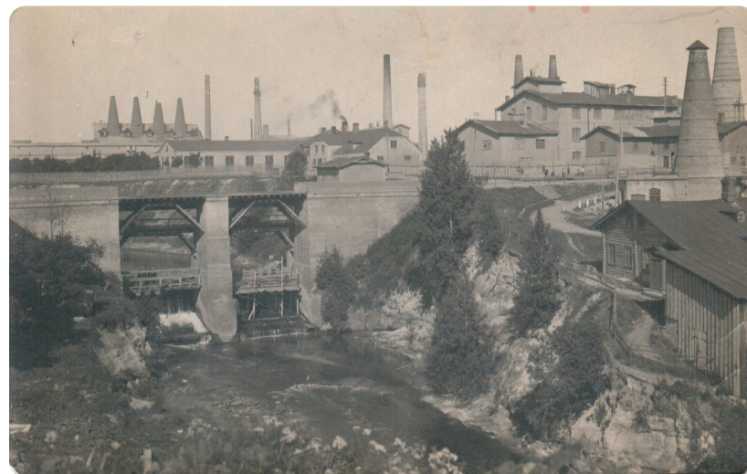
Vaade vabrikule 1915, KM F 9-2. Fotograaf A. Paiku

Kunda Linnavalitsusel ja Eesti Muinsuskaitse Seltsil on heameel paluda Teid osa võtma seminarist